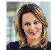
Anja Reschke NDR